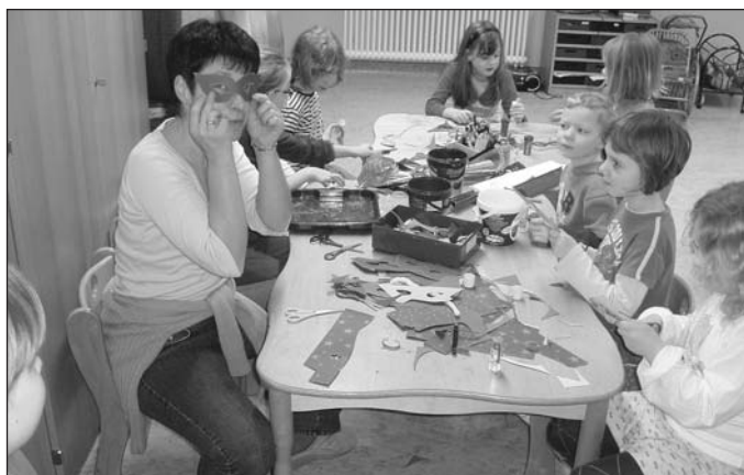
Die Schüler und Erzieherinnen der Traumzauberbaumschule Weißensee