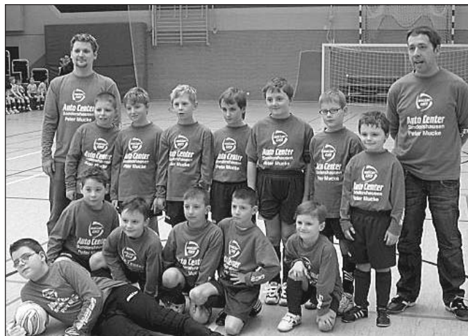
Die F-Junioren des FC Weißensee 03

Die B-Junioren bedanken sich bei allen Helfer die zum guten Gelingen des Turniers beigetragen haben. Ein ganz besonderer Dank geht an den Geschäftsführer des Vereins Lohnsteuerhilfe e.V. für die Finanzielle Unterstützung der B-Junioren.