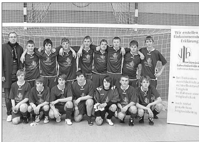
Die B-Junioren mit ihrem Sponsor.