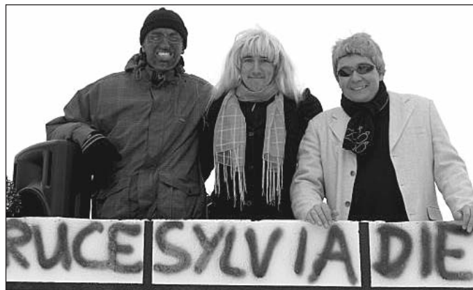
Unsere Jury von Weißensee sucht das Supertalent.